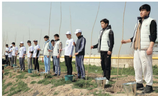
Хуқуқий асослар ва давлат сиёсати

Бугунги кунда Ўзбекистонда амалга оширилаётган ободонлаштириш ва кўкаламзорлаштириш ишлари фақатгина эстетик кўришни яхшилаш билан чекланмайди. Ушбу йўналиш мамлакат иқтисодиётининг барқарор ривожланишига хизмат қилувчи, туризм, кўчмас мулк бозори ҳамда энергия самарадорлигини рағбатлантирувчи муҳим стратегик соҳага айланиб бормоқда.